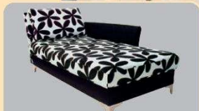
Planungsbeispiel: Melody 87, Rücken links, mit Armlehne A2 und Fuß F2