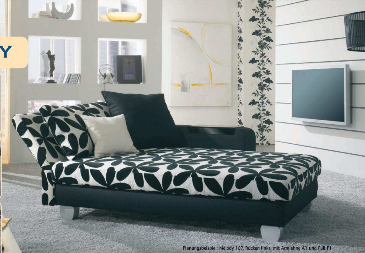
Planungsbeispiel: Melody 107, Rücken links, mit Armlehne A1 und Fuß F1