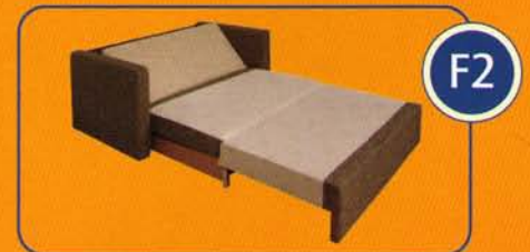
Liegehöhe ca. 30 cm mit 13-fach verstellbarem Kopfteil