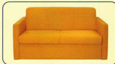
Korpus, Sitz u. Rückenlehne im gleichen Stoff bezogen