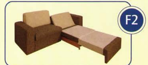
Liegehöhe ca. 30 cm mit 13-fach verstellbarem Kopfteil