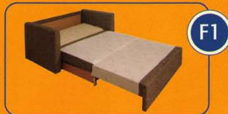
Liegehöhe ca. 30 cm

Schlafen Sie lieber auf der klassischen Liegehöhe von 30 cm oder lieber auf der Komfort-Liegehöhe von 43 cm? Möchten Sie zusätzlich eine 13-fach-Kopfteilverstellung für eine noch bequemere Liegeposition?