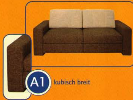
A1 kubisch breit

4 Armlehnen stehen Ihnen zur Auswahl, von modern bis klassisch.