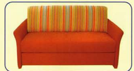
Korpus u. Sitz in einem Stoff und Rückenlehne in einem Absetzstoff bezogen