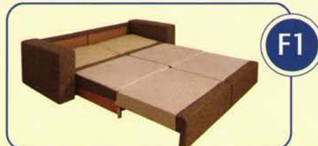
Liegehöhe ca. 30 cm

Bei diesem Sofa bekommen Sie die Funktionen sogar 2-fach. So können Sie gleichzeitig eine Liegefläche zum Sitzen, Relaxen oder Schlafen nutzen, während die andere Seite einfach geschlossen bleibt.