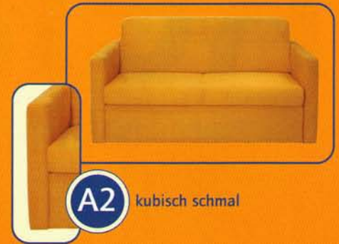
A2 kubisch schmal